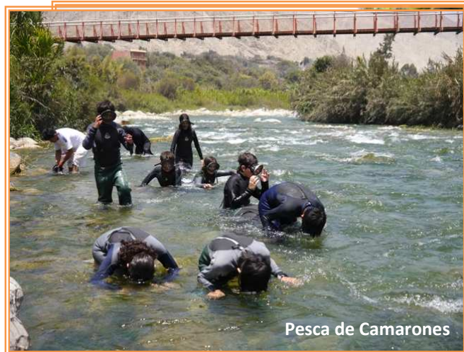
Pesca de Camarones

Actividad 100% vivencial dirigida a niños y jóvenes desde los 11 años. En esta actividad cada alumno participa de manera efectiva en la pesca de camarones al estilo y usanza de los pescadores de Lunahuaná, para ello se proporciona a cada participante del equipo necesario para la actividad: wetsuits de cuerpo completo (trajes de neopreno marca BOZ), caretas de pesca (el modelo utilizado para buceo en río), redes de acopiamiento, instructores, personal de seguridad y rescate, altoparlantes, etc. Los técnicos pescadores son miembros de las Asociaciones de Camaroneros de Lunahuaná y tienen muchos años en la actividad; asimismo, tienen la técnica y experiencia necesarias para el dictado de charlas.