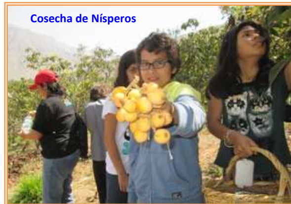
Cosecha de Nísperos