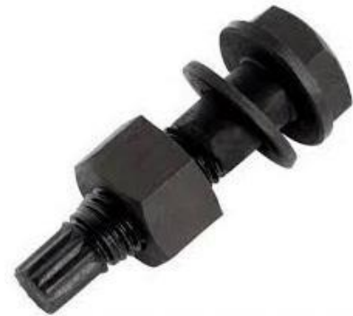
A325 C/CONTROL DE TORQUE

Para este tipo de pernos estructurales, las tuercas complementarias recomendadas varían de acuerdo a los siguientes grados: A563C, C3, D, DH, DH3, A563DH, A194-2H. Las arandelas son complementarias F436-1